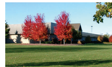
Fox-Valley- Technical College