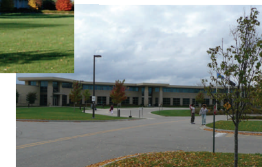
Blackhawk - Technical-College